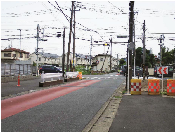
→改良事業が進行中の鶴野森旧道交差点

今年も大野中公民館区のスローピッチ大会に選手として参加しました。たくさん打られました。